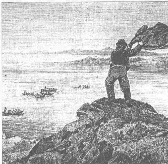
Így halászták „a látott halat”, a gardát, egykor a Balatonon – mutatja be Herman Ottó nagy munkája, A magyar halászat könyve. A horgászok süllőzés közben, kishallal ma is szép gardákat fognak

Fél tíz, mire vizet ér, loccsánva a messzeségben, az etetőkosaras készség (cél: a dévérek, a pontyok), illetőleg – hang nélkül, a partközélemben – az ellapított ólom, a süllőző készség. A pontyozón kukorica, a süllőzőn kishal. Tököt van, eltekintve a zseblámpafénytől, a Hold sehol, igaz, az ég csillagos, sejlik is a Tejút selyme, a kapásjelző karikák moccsanlatnok. Egyes-egyedül vagyok.