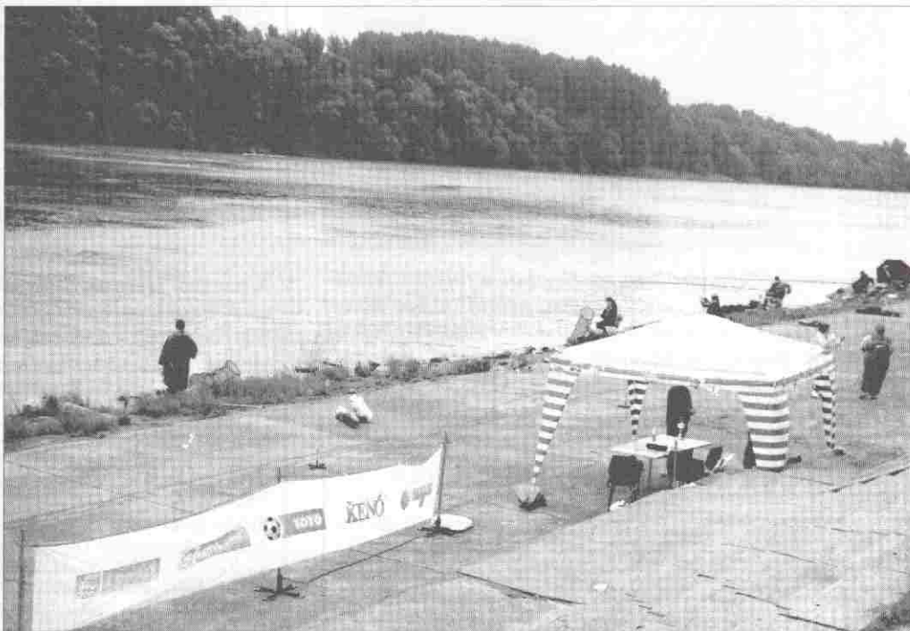
Megy a Rakpart-kupa. Garantáltan nem volt semmi szabálytalanság!