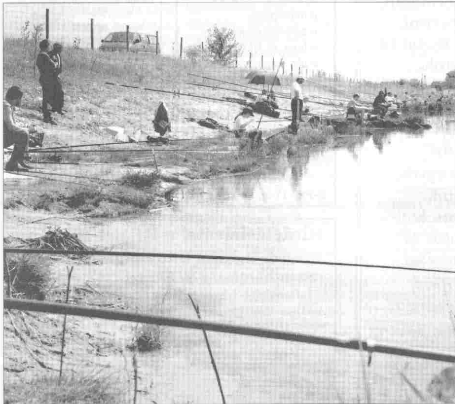
Horgászok a Sándorfalvi-tavon. Egyesületi tavunk ilyenkor, ősszel is jó halfogási lehetőségeket kínál.